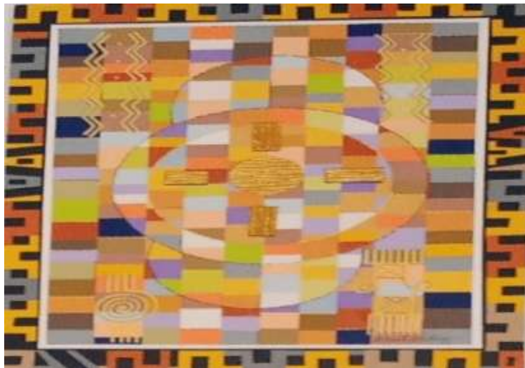
Figure 3 : Une œuvre revendiquant l'abstraction géométrique de Tano Mathurin

le 21/02/2026 entre 15 et 16 h.