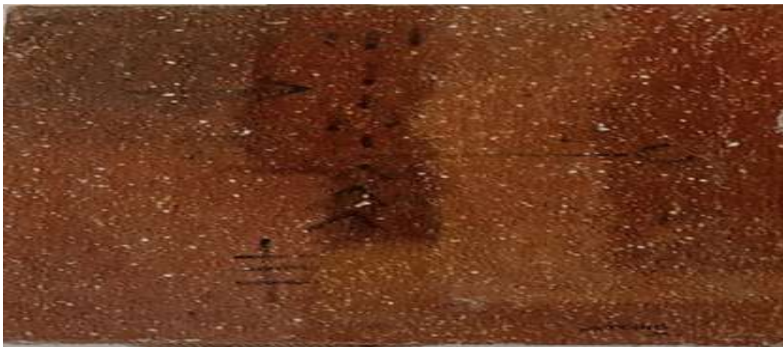
Figure 4 : une œuvre revendiquant l'abstraction lyrique de Watt Kang

Photo prise par Assoumou Krou, le 21/02/2026 entre 15 et 16 h.