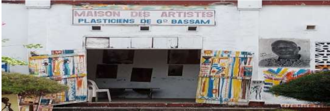
Figure 1 : Vue extérieure de la "Maison des artistes"

Photo prise par Assoumou Krou, le 21/02/2026 à 15 h.