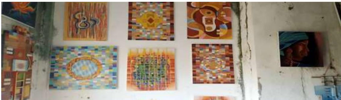
Figure 13 : Exposition des œuvres d'Alfred Sasan dans son atelier

le 21/02/2026 entre 15 et 16 h.