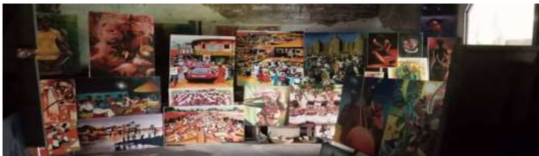
le 21/02/2026 entre 15 et 16 h.