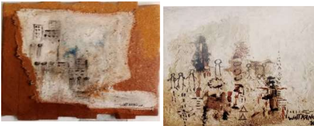
le 21/02/2026 entre 15 et 16 h.