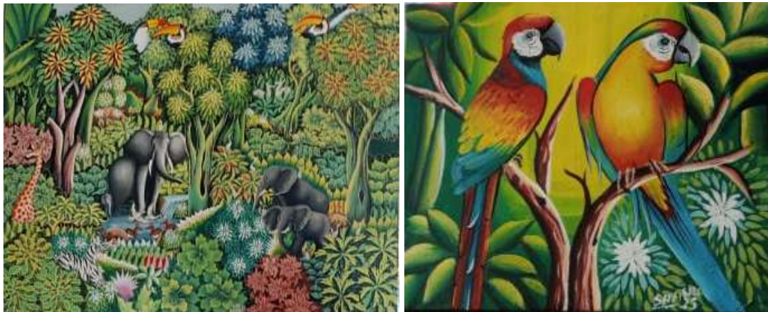
le 21/02/2026 entre 15 et 16 h.