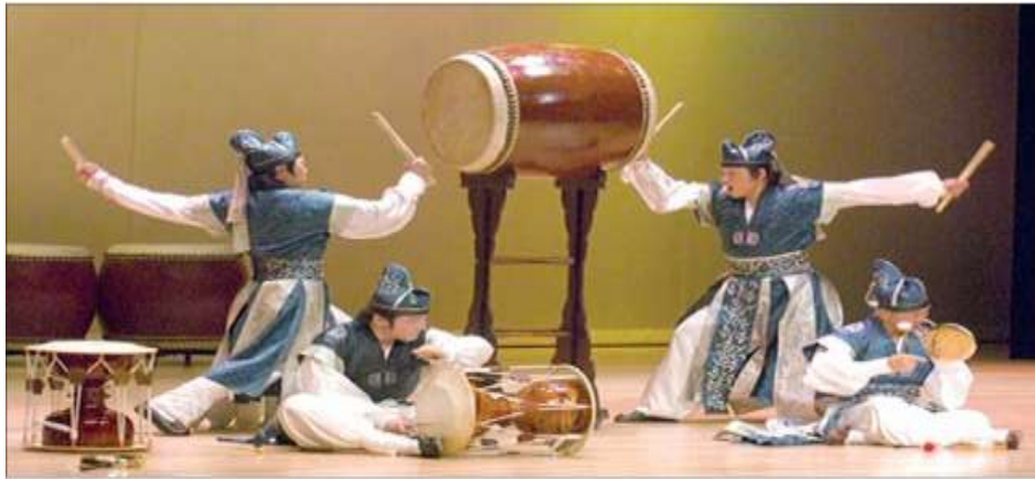
Photo : La troupe coréenne en prestation

Source : Archives de Fraternité-Matin du 21 octobre 2011, p. 23.